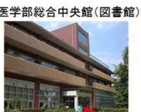
左側に医学部図書館 3階 M1室へ