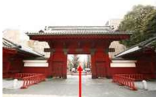
赤門から入って直進