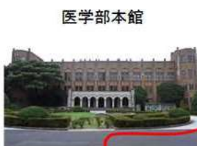
医学部本館の右脇を進む